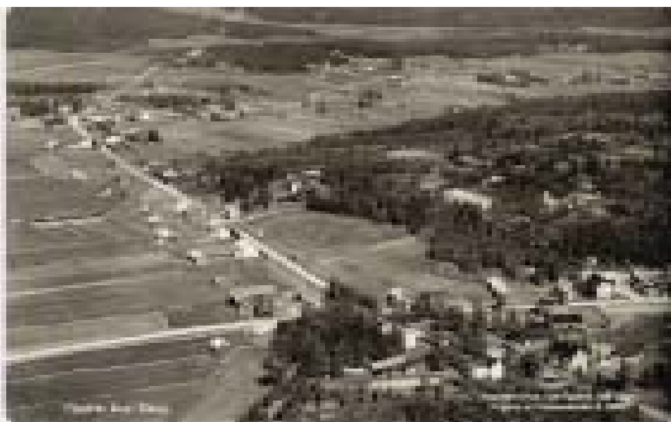
Foto från förr

■ Som alla säkert kan se är vi i Sikeå. Det tar kanske en stund att orientera sig fram på bilden, men till höger har vi sikaberget att ta fasta på. Frågan är när är flygfotot taget, någon därute i läsekretsen har kanske svaret?