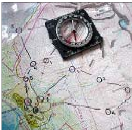
Karta och kompass.