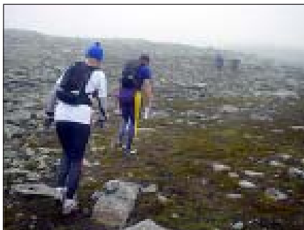
In i dimman.

Nu har hösten kommit och vi kommer att påbörja träningen inför 2006 års Arctic-KIMM. Nu vet vi lite mera om tävlingen och hur vi ska lägga upp träningen. Håll utkik efter "Team Sikeå" någonstans i de svenska fjällmassiven.