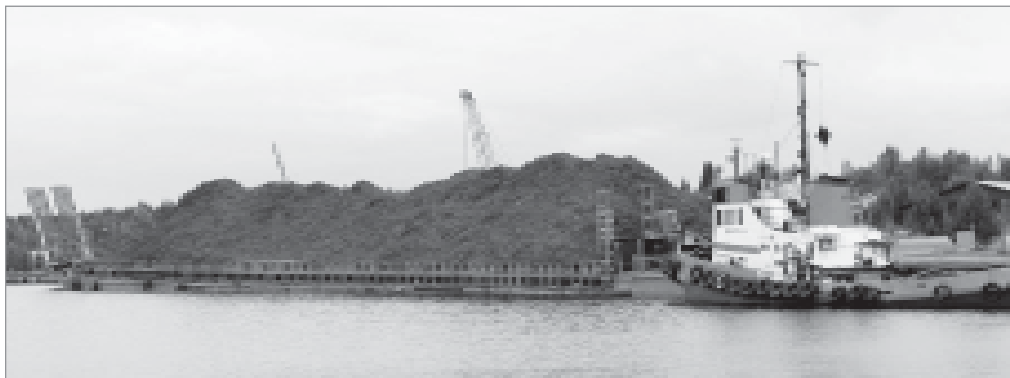
I 1500 ton bark på väg till Kramfors mellanlandade i Sikeå hamn i somras. Ett mäktigt ekipage!

Ekipaget ägs av före detta Wiréns Rederi från Piteå som skulle transportera barken från Kalix till Kramfors. EOL har en motor på cirka 500 hästkrafter, vilket ger en fart på ungefär två knop. Det innebär en restid Sikeå-Kramfors på två dygn.