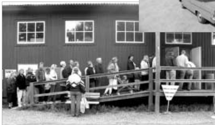
Årets kö – säsongpremiär hos Andra Varvet.