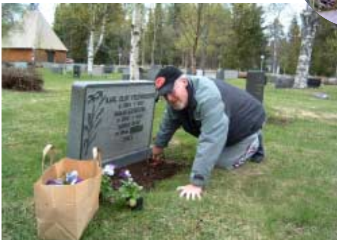
Bråda tider att plantera i täppan och vid graven.