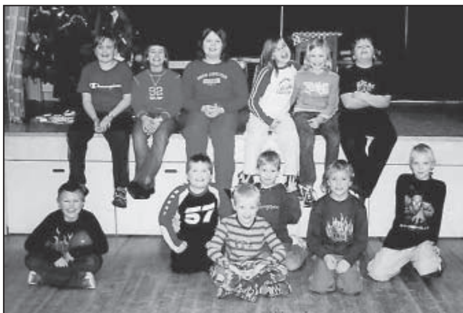
Torsdagkvällar på Träffpunkten är ett populärt ställe för många av byns ungdomar.

Sektionen ansvarar också för att isen på Drömvallens hockeybana är åkbar och att fotbollsplanen hålls i ett bra skick på sommaren. Under förra året fick värme-stugan en upprustning. Den lyftes och