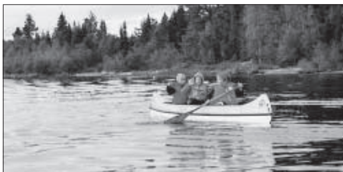
Upplev gemenskap och äventyr med scouterna.

Scoutland som området kallas behöver röjas från en