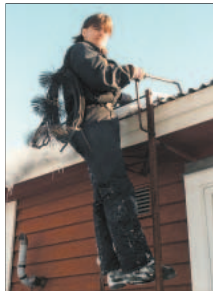
Klättra upp på tak och sota själv – nej tack, bäst att låta yrkeskunnigt folk sköta sotningen.