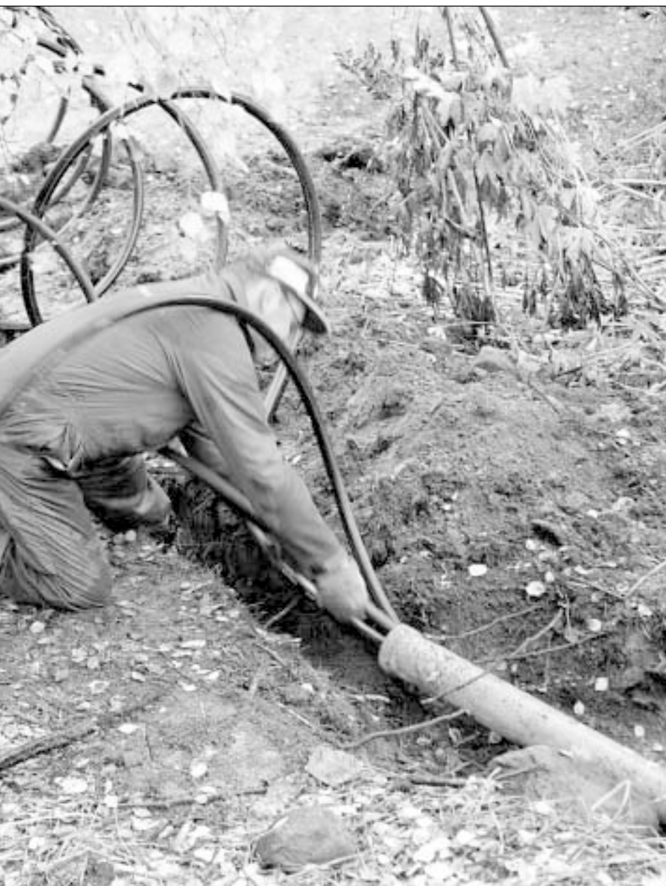
opto-rör under Hamnvägen nere i Sikeåhamn. Många meter rör har det