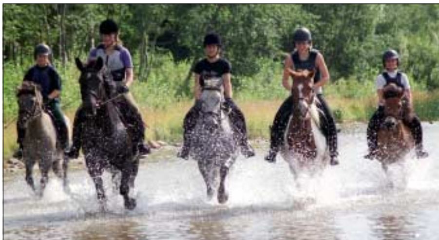
Ett gäng tjejer från Sandgårdans ridklubb tog tillfället i akt och red i vattnet nere vid Östersia när sensommaren var varm och behaglig.