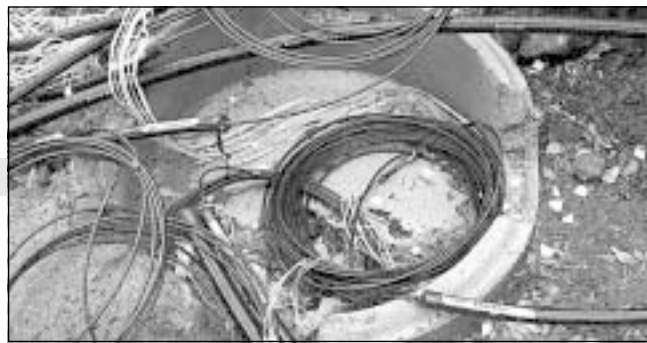
Uppkoppling via modem är snart ett minne bort...