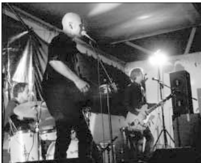
Tupolev Honey från Umeå var ett banden på festivalen.

FÖRST UPP på scenen, som bestod av ett lastbilsflak riggat med ljus och ljudutrustning, var arrangörernas band The Celebrities, ett uppskattat uppträdande men kanske i kortaste laget tyckte vissa. Sedan var det dags för det andra lokala bandet för kvällen, skatepunkarna i Moving Coil. Nu hade även delar ur publiken