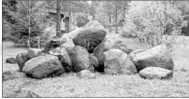
Stenrika sikabor finns det gott om...