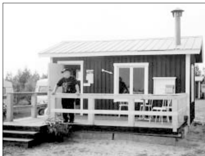
Likt en skeppare spanar Sture Svahn ut från bryggan. Nåja, altanen har i alla fall fått ett nytt räcke.

Belysning drogs till långtidscampingen och stugorna