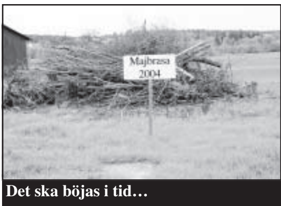
Det ska böjas i tid...

VANDRARHEM I HAMNEN? Nej det har vi inte men däremot ett vandrande hus. Den gamla klubbstugan som nu får en ny brädfodring och skall bli den nya receptionen.