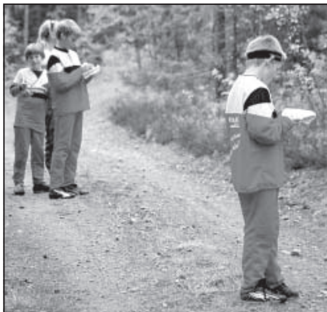
En bit upp efter Gammellandsvägen blev det läge att kolla karta och kompass.

Redaktören fann det för gott att röra på påkarna för att hålla värmen, med ett par kliv var man så att säga ute bland grönsakerna. (Red)