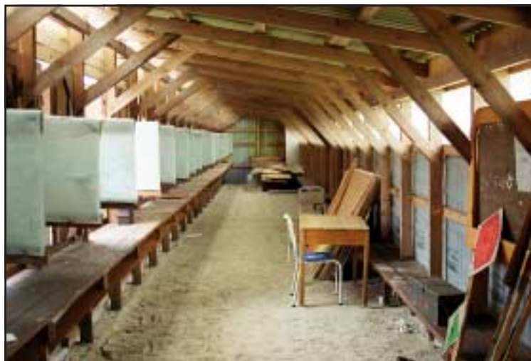
Pistolsskytteklubben har byggt upp en riktigt trevlig anläggning och bättre ska den bli, säger Bert-Ove Ståhl.