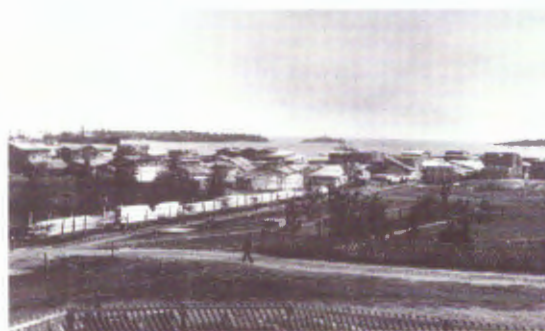
Bilden, som är tagen från Tullgården, visar hamnen i början av 1900-talet, innan de stora magasinerna byggts