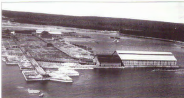
Hamnen på 1920-talet