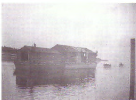
Midsommarpråmarna på väg till Kungsön