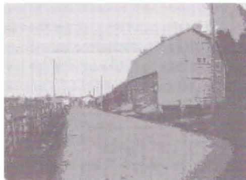
Sikeås första biograf från 1920-talet